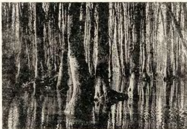
Čista sastojina jasena u Lipovljanima

Šuma poljskog jasena obrađuje kratkotrajne, osrednje i dugotrajne bare. Razlike u sastavu, izgledu i gospodarskoj vrijednosti sastojina na ovim reljefnim oblicima, vrlo su velike.