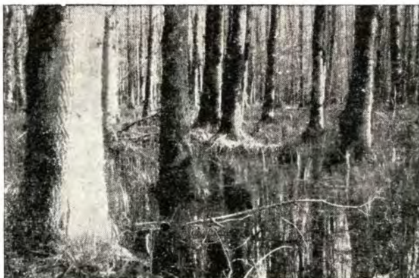
Šuma jasena s kasnim drijemovcem (rano proljeće)

Čiste sastojine jasena u Posavini, koje zauzimaju reljefne depresije gdje duže ili kraće vrijeme stagnira voda, shvatio je još Josip Kozarac (1886.) kao posebni tip šume. Generacije posavskih šumara također su izdvajale barsku šumu jasena u poseban tip, ne samo zbog njenog različitog izgleda i životnih prilika, nego i zbog različitih gospodarskih mjera, koje su u njoj provodili (odvodnja, pomlađivanje i t. d.). No usprkos toga, barska šuma jasena ostala je sa gledišta nauke o vegetaciji gotovo nepoznata. U fundamentalnoj raspravi »Biljnosociološka istraživanja šuma u Hrvatskoj«, opisao je Horvat (1938.) šumu lužnjaka sa velikom žutilovkom i šumu lužnjaka i graba, i time postavio temelj modernoj tipologiji naših nizin-