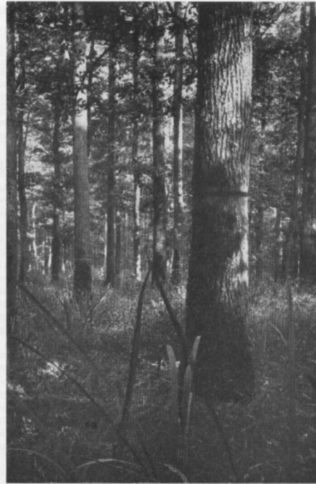
Abb. 254: Genisto-Quercetum robori caricetosum remotae im Frühsommer bei Lipovljani. Im Vordergrund Iris pseudacorus

Die mäßig nasse Variante ist die für das Gesellschaftsgefüge optimale. Eine relativ trockene leitet zu den Eichenauen über, auf die wir in Abschnitt 4.144 eingehen werden.