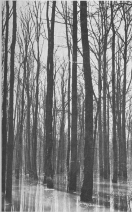
Abb. 253: Eichen-Auenwald während der Vorfrühlings-Überflutung bei Lipovljani