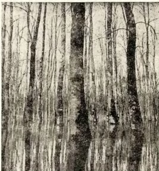
Sastojina jasena sa kasnim drijemovcem u G. j. Greda—Kamare dne 27. IV. 1958.

Dužina i način plavljenja osnovni su ekološki faktori šume barskog jasena, koji određuju sastav zajednice, te izgled i uspijevanje njenih pojedinih članova.