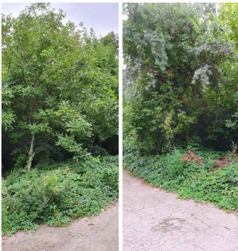
Рис. 1. Біотопи С 2.1.3. Просанні культури дерев, чагарників і чагарникових ліан та Д 1.8. Антропогенні широколистяні ліси біля парку Феофанія

Вверх від села зліва розташовані насадження грабу Carpinus betulus , які через інтенсивне господарювання та регулярне вирубування підросту та підліску інших видів на початку століття трансформувалися