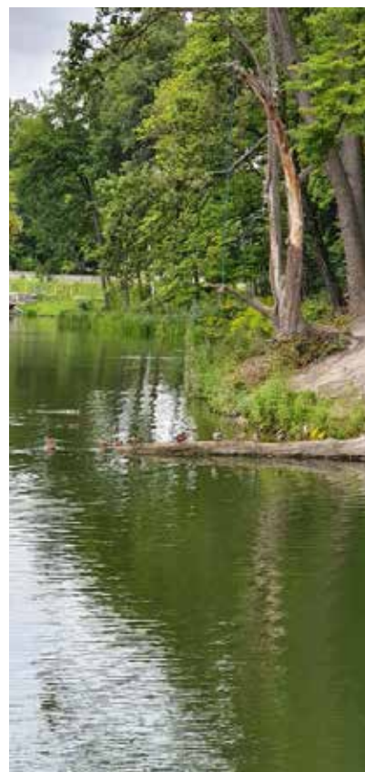
Рис. 6. Біотопи В 1.3. Ділянки постійних непроточних водойм без вищої водної рослинності, В 3.3. Ділянки водотоків без вищої водної рослинності ставків парку Феофанія