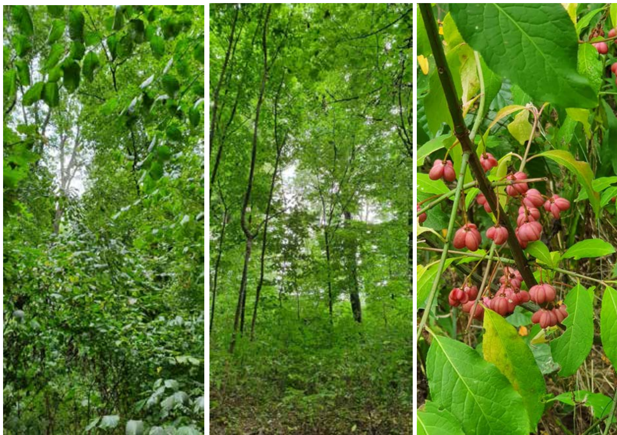
Рис. 5. Біотоп Д. 1.2.2. Східноєвропейські мезофільні евтрофні ліси дуба звичайного і липи серцелистої лісової зони на території парку Феофанія

Другий лісовий біотоп представлений досить трансформованим грабово-дубовим чи грабовим лісом на багатих ґрунтах. Тут у трав'яному покриві переважають Stellaria holostea , Lamium galeobdolon , а весною утворюють яскравий килим Corydalis solida , C. intermedia , Dentaria bulbifera . У зниженій ділянці лісового ценозу з Populus alba зафіксовано дорослий екземпляр ще одного виду з високою інвазійною активністю – Quercus rubra з поновленням.