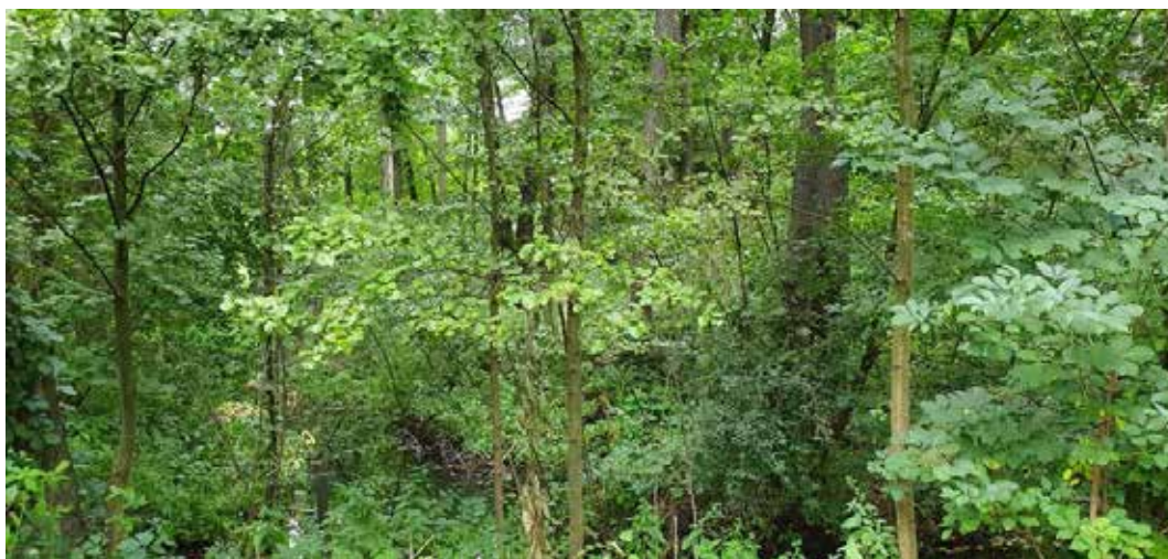
Рис. 7. Елемент біотопу Д 1.6.2 Вологі та періодично вологі ліси з домінуванням дуба звичайного або видів в'яза