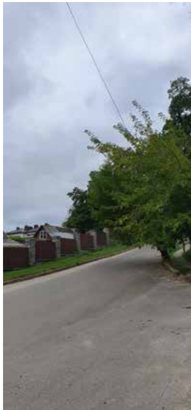
Рис. 4. Село Хотів, що межує з парком, представлено Комплексом біотопів С 3.3. забудованих територій

у «грабові плантації». Прямуючи до центральної частини парку, по обидва боки маршруту території парку спостерігаємо лісові угруповання біотопів Д. 1.2.2. Східноєвропейські мезофільні евтрофні ліси дуба звичайного і липи серцелистої лісової зони, де після рубок спостерігаються елементи біотопу Д. 1.2.1. Центральноєвропейські грабово-дубові ліси.