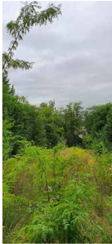
Рис. 3. Трансформований біотоп Т 5.2.1. Мезофітні узлісся та галявини на нейтральних і слабодужних ґрунтах на території парку Феофанія